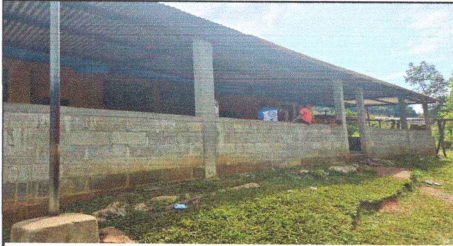
Foto 1: Sustitución de costaneras de madera ya que se encuentran en mal estado