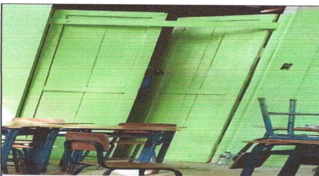
Foto 5: Sustitución de puerta de madera a metal ya que se encuentra en mal estado