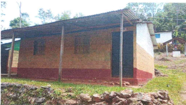
Foto 3: Sustitución de estructura de madera a metal ya que se encuentra en mal estado